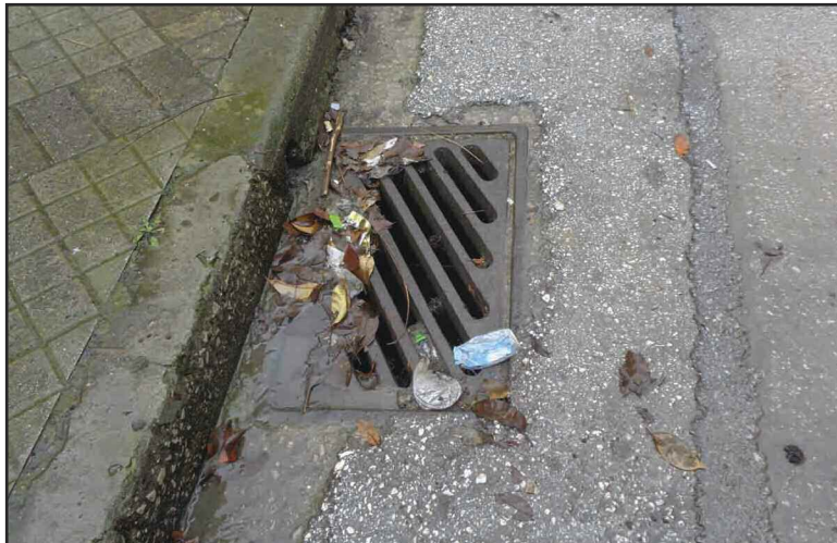
Μέρες βροχές και τα φρεάτια γεμάτα σκουπίδια!!!