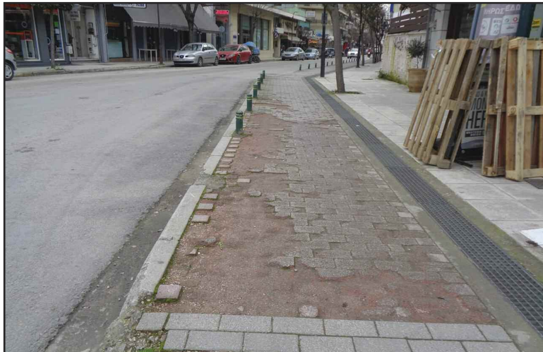
Ακόμα να αποκατασταθούν οι φθορές στον ποδηλατόδρομο επί της Καραϊσκάκη!!!