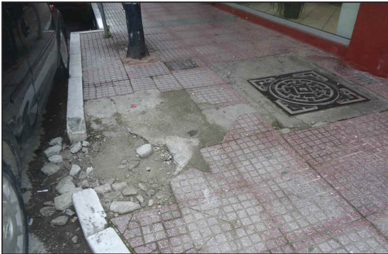
Άκρως επικίνδυνο το εικονιζόμενο πεζοδρόμιο!!!