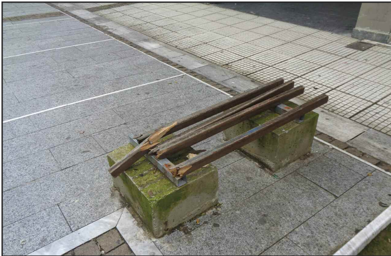
Ένα παγκάκι στο κέντρο της Καρδίτσας εντελώς επικίνδυνο!!!