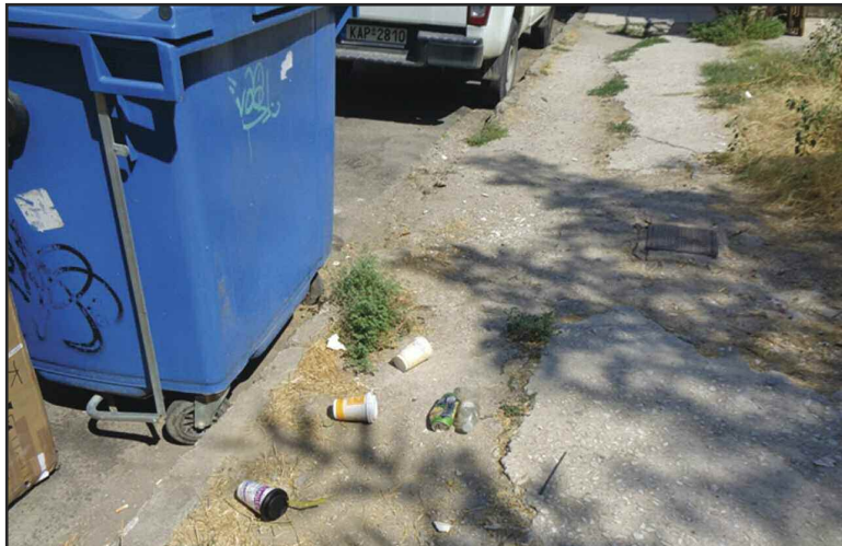
Παντού σκουπίδια!!! Πόση ασυνειδησία!!!