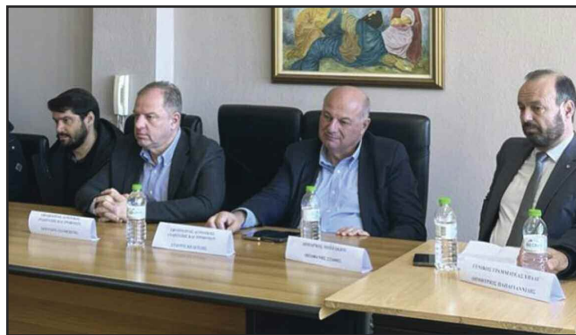
Κυβερνητικό κλιμάκιο στην Καρδίτσα για τους πληγέντες της Θεσσαλίας

25/1: Επίθεση των ΜΑΤ κατά των αγροτών στον κόμβο του Ε65.