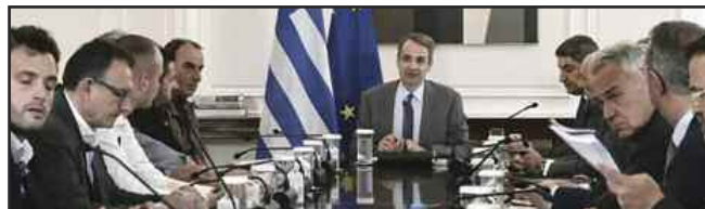
Συνάντηση του Πρωθυπουργού με αγρότες στην Αθήνα