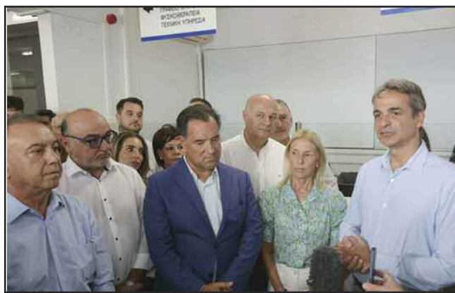
Ο Πρωθυπουργός Κυριάκος Μητσοτάκης εγκαινίασε το νέο Κέντρο Υγείας Μουζακίου και το Τμήμα ΕΚΑΒ Παλαμά

5/10: Επισκέψεις Στέφανου Κασσελάκη και Ζωής Κωνσταντοπούλου στη