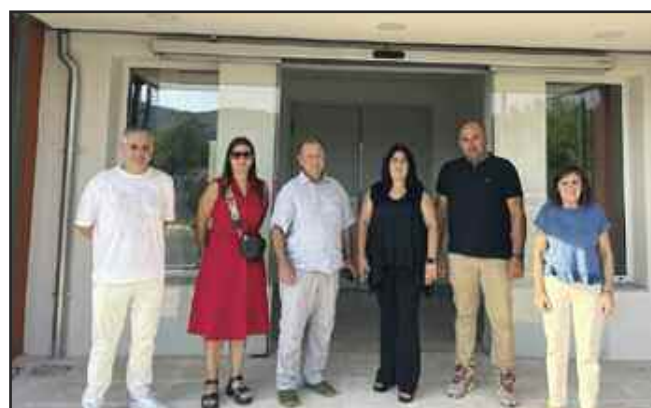
Υπεγράφη το πρωτόκολλο διοικητικής παραλαβής προς χρήση του Κέντρου Υγείας Μουζακίου

8/7: Δημοπρατήθηκε το αρδευτικό δίκτυο Υπέρειας-Ορφανών.