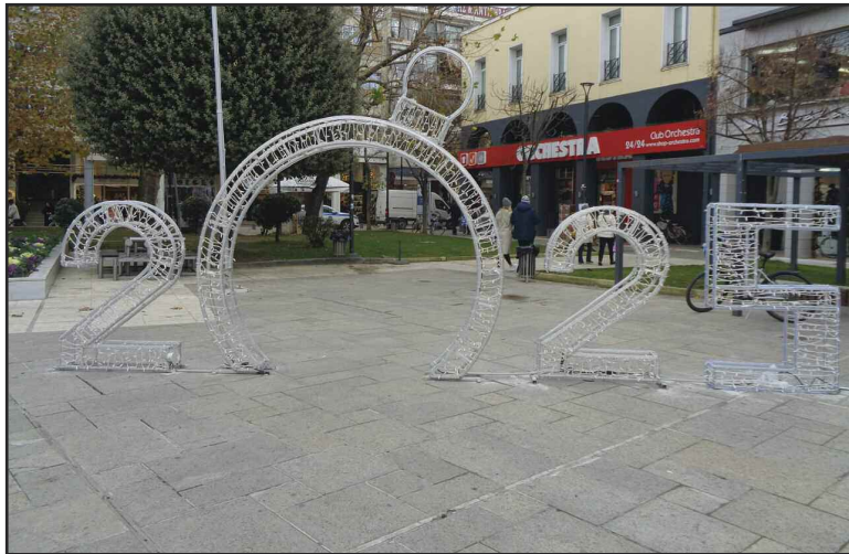
Η Καρδίτσα ετοιμάζεται να υποδεχτεί τη νέα χρονιά!!!