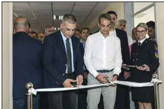
Ο Πρωθυπουργός Κυριάκος Μητσοτάκης εγκαινίασε το Κέντρο Πολιτικής Προστασίας της Περιφέρειας Θεσσαλίας

15/6: Υπουργός Αγροτικής Ανάπτυξης και Τροφίμων αναλαμβάνει ο βουλευτής Καρδίτσας Κώστας Τσιάρας.