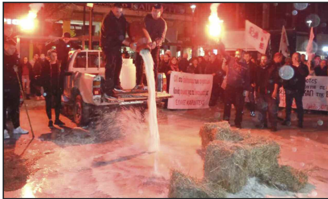
Νέο αγροτικό συλλαλητήριο στην κεντρική πλατεία της Καρδίτσας

10/2: Συλλαλητήριο των αγροτών στην κεντρική πλατεία