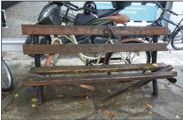
Κατεστραμμένο παραμένει το παγκάκι στο Εμπορικό κέντρο!!!