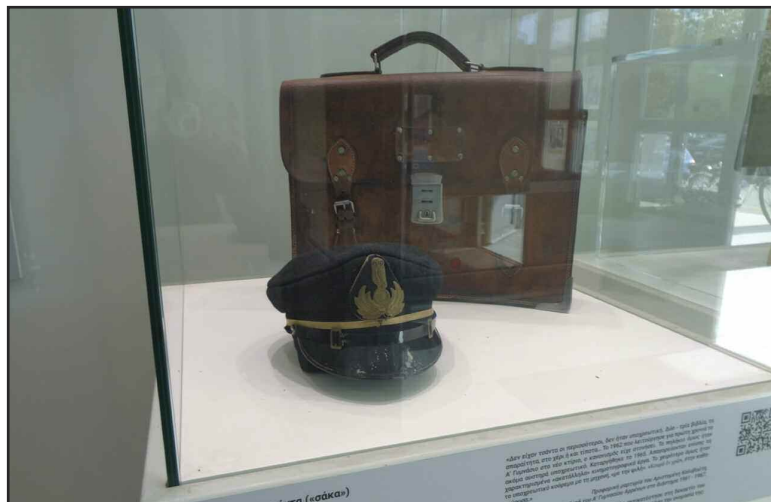
Μια σχολική τσάντα του 1960 στην είσοδο του Δημαρχείου Καρδίτσας!!!