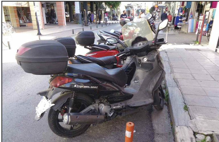
Θετικό το μέτρο να υπάρχει ειδική λωρίδα για τη στάθμευση των δικύκλων!!!