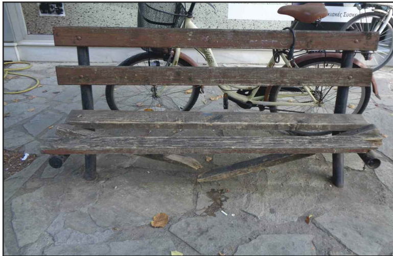
Ακόμα κατεστραμμένο παραμένει το συγκεκριμένο παγκάκι στο Εμπορικό κέντρο!!!