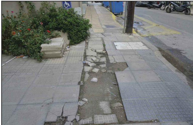
Ένα ακόμα πεζοδρόμιο με σπασμένα πλακάκια!!!