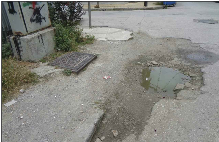
Ένα κατεστραμμένο πεζοδρόμιο που έγινε και μια μικρή λίμνη!!!