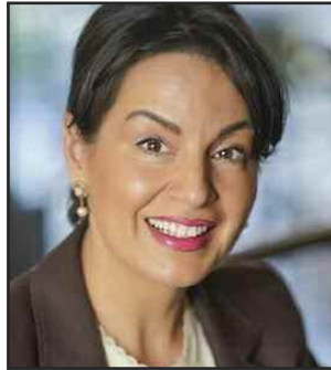
γειές της με σκοπό την εύρυθμη λειτουργία

Αναφορά προς την κ. Υπουργό Κοινωνικής Συνοχής και Οικογένειας, κατέθεσε η Βουλευτής Τρικάλων του ΣΥΡΙΖΑ-Προοδευτική Συμμαχία Μαρίνα Κοντοτόλη, προκειμένου να απαντήσει στη Βουλή στα αιτήματα του Συλλόγου Εργαζομένων, για τις ενέρ-