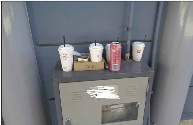
Κυριολεκτικά όπου να 'ναι πετάνε τα σκουπίδια τους ορισμένοι!!!