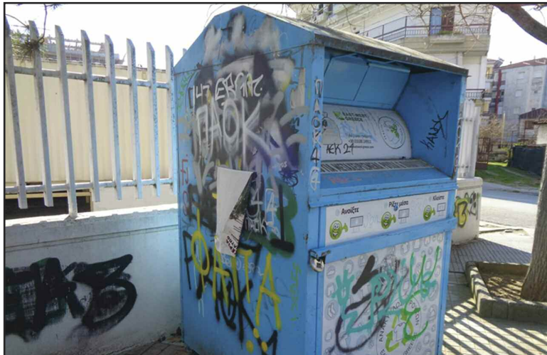
Τα γκράφιτις και η αφισορύπανση καλά κρατούν!!!