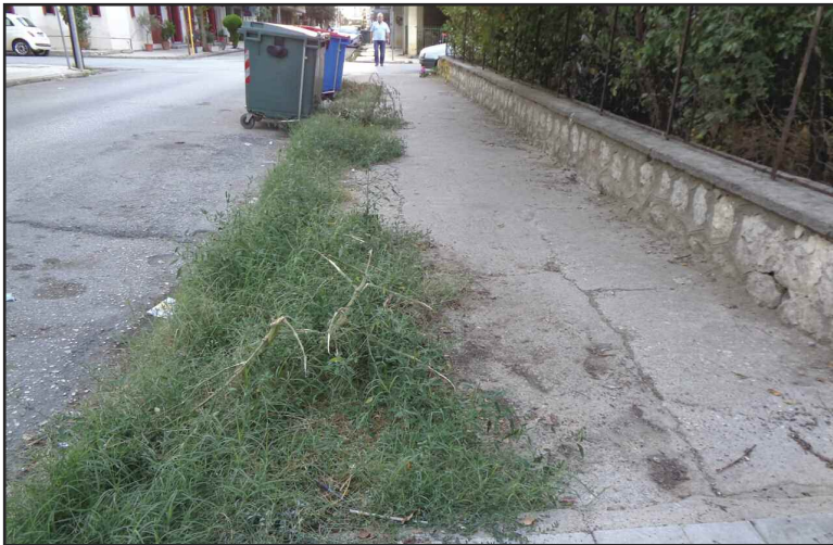
Ένα πεζοδρόμιο γεμάτο χόρτα!!!