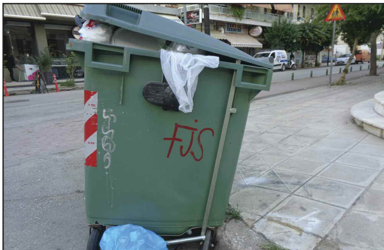
Μη και μάθουμε πώς και που να πετάμε τα σκουπίδια μας!!!