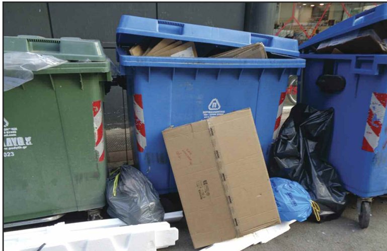
Τα σκουπίδια κατάφεραν και κάλυψαν μέχρι και τους κάδους!!!