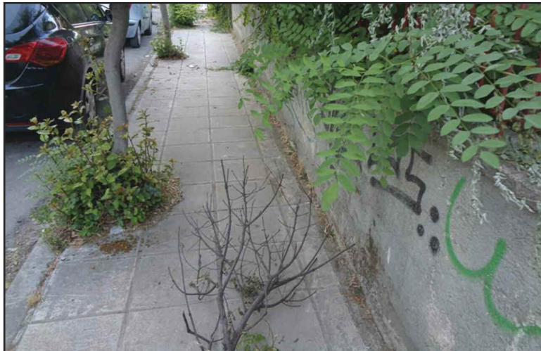
Ένα πεζοδρόμιο που θυμίζει «ζούγκλα»!!!